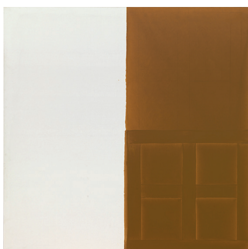
Jacob, ca. 1974, Ölfarben auf Leinwand, 194 x 194 cm Kunstmuseum Winterthur

James Bishops Bilder gehen aus von einfachen Gerüsten, die gleichermassen als elementare Ableitung von der quadratischen Form des Bildes wie als typisierte Formen erscheinen. Sie sind verhüllt von Schichten von Ölfarbe, die fein, fast hautartig, Teile der Fläche überziehen. So entsteht nicht der Eindruck der Übermalung der vorgezeichneten Struktur; vielmehr kommt die Gestik des Malers darin zum Stillstand und verzögert das Hervortreten der Formen. Bishop bringt eine Zeitlichkeit in die Malerei ein, die jede Bewegung unendlich verlangsamt nachvollziehen lässt.