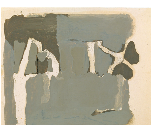
Untitled, ca. 1980–1990, Ölfarben auf Papier, 19,2 x 25,6 cm Kunstmuseum Winterthur, Foto: SIK-ISEA, Zürich (Philipp Hitz)

Ein Bild von 1975 mit zwei ockerfarbigen, übereinandergestellten Teilquadraten hat Bishop «Jacob» betitelt, die französische Übersetzung seines Vornamens James. Ein Selbstbildnis? Wo man das Subjektive sucht, antwortet Bishop mit der historischen Reminiszenz, und wo man materielle Objektivität zu finden glaubt, weist er auf die eigene Geschichte hin: Braun und Grau als Chiffren persönlicher Erfahrung – Bedeutungen, die eine nach der anderen aus den namenlosen Farben heraustreten. Für Bishop existiert das Bild nur, wenn es über seine Materialität hinausweist. Er versichert, «dass Malerei eine Sprache ist», und zitiert ein Wort Alban Bergs zu Schönberg, «dass man bloss die Sprache lernen müsse und dass Schönbergs Musik dann überhaupt nicht schwierig sei».